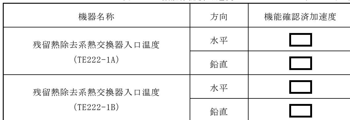
表 4-3 機能確認済加速度 (×9.8m/s 2 )