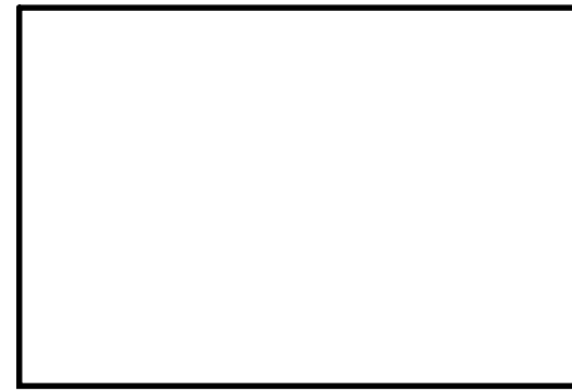
A ~ A 断面図