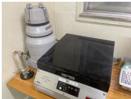
β線スペクトロメータ