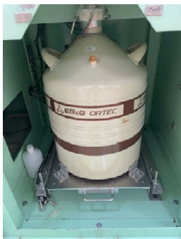
γ線スペクトロメータ