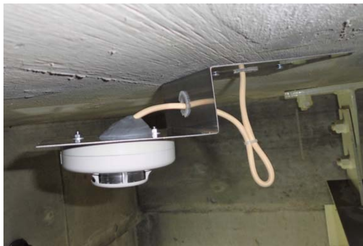
写真 1 結露水浸入防止用の台座

平成 29 年度は、核サ研及び原科研において、湿気の影響と思われる火災警報の吹鳴が頻発した。このため、結露が発生しやすい場所に設置された感知器への“結露水浸入防止用の治具” (写真 1) の設置 (核サ研)、除湿器の設置 (原科研) を行うことにより再発防止を図った結果、結露を起因とした誤警報の発生数が減少した。