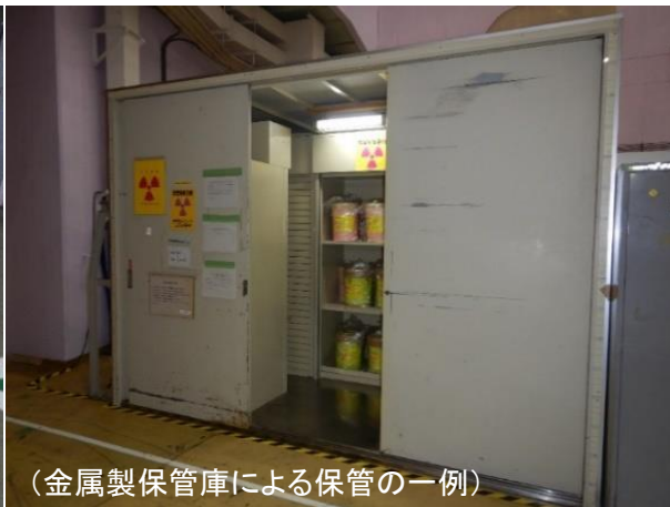
(金属製保管庫による保管の一例)