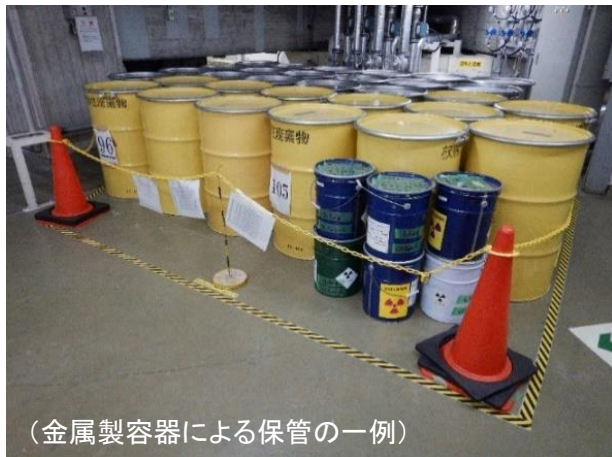
(金属製容器による保管の一例)