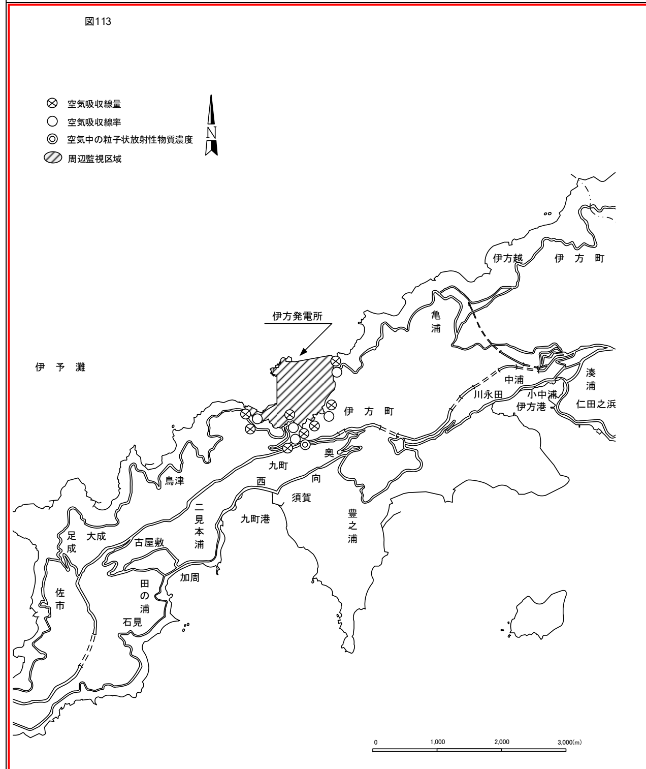
変更後の第1編 (運転段階の発電用原子炉施設編)