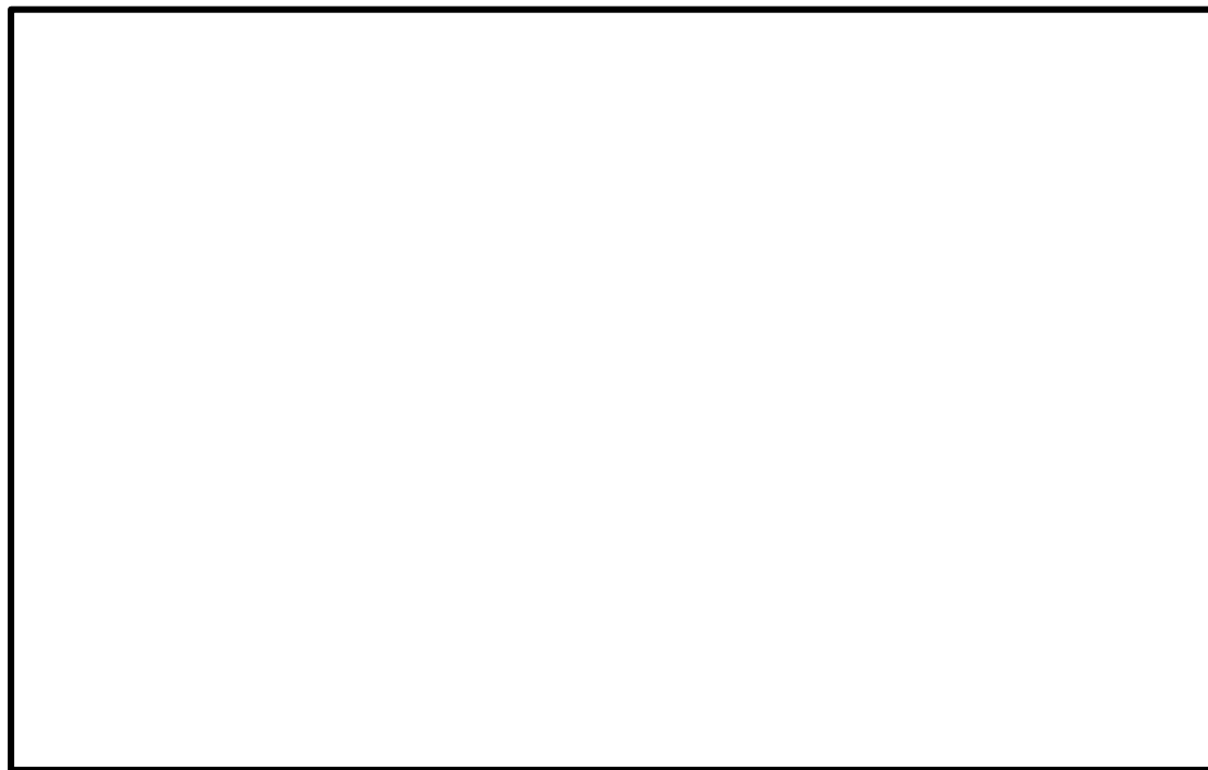
図 3-1 配管貫通部ベローズの形状

配管貫通部ベローズの形状を図 3-1 に、ベント管ベローズの形状を図 3-2 に示し、ベローズの主要寸法を表 3-1 に示す。