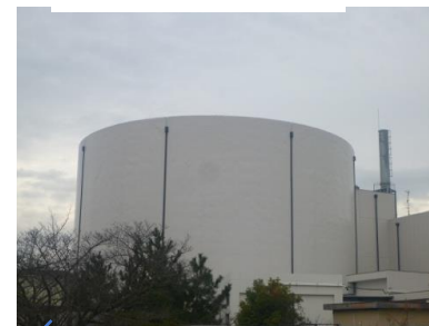
原子炉格納施設外観