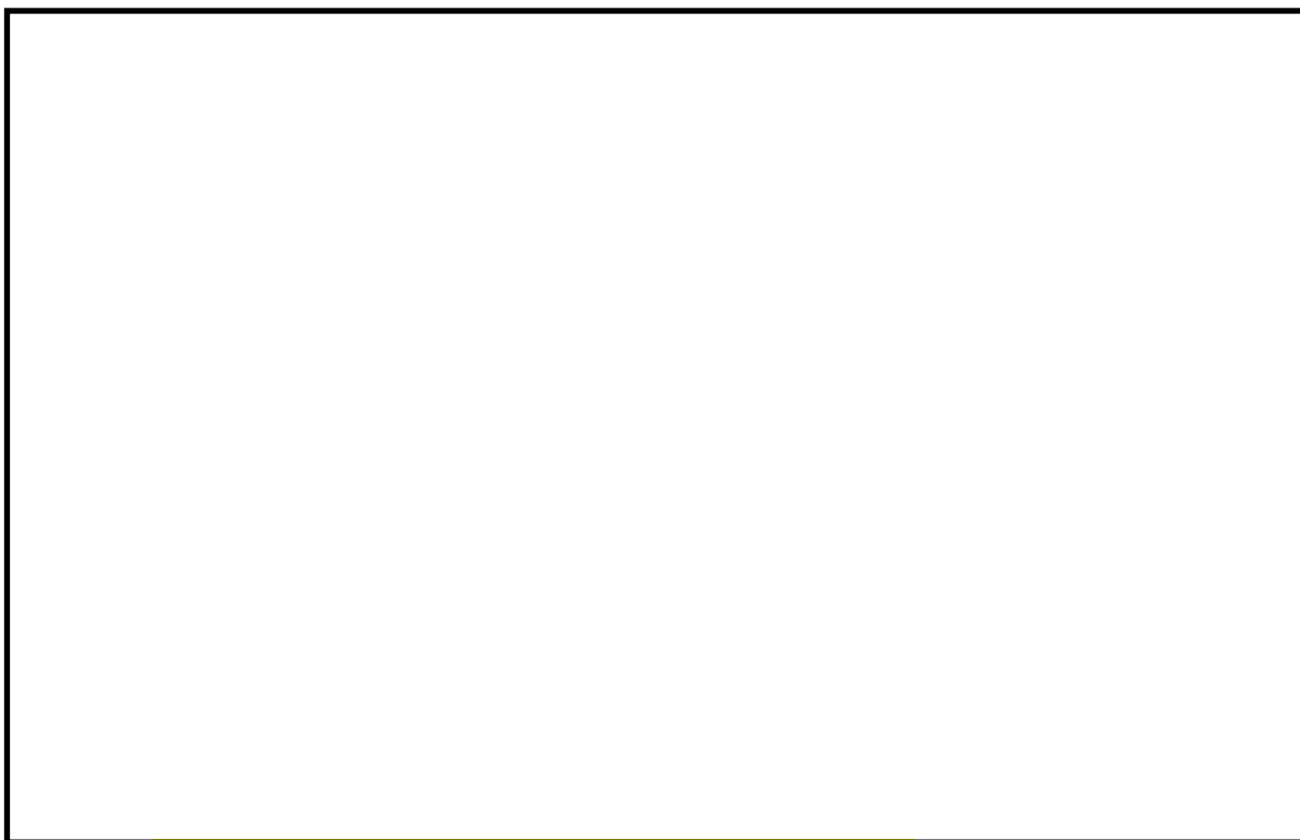
図 3-2 振動モード (2次モード 水平方向 0.052s)