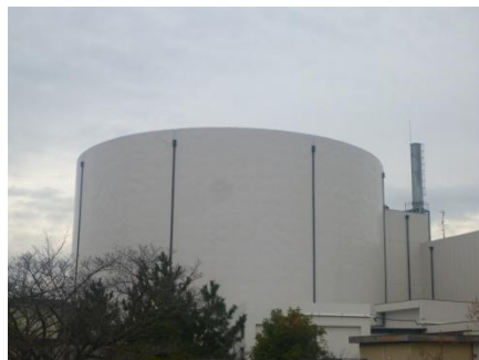
原子炉格納施設外観