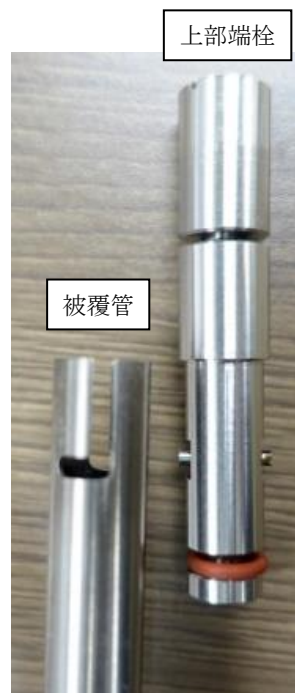
図 1 燃料試料挿入管（試作品）の上部外観

なお、原子炉設置（変更）許可申請書（添付書類八 別 1 第 6.1-1 表(2)）において、燃料試料挿入管の上部端栓の位置（被覆管の固定用切り欠き高さ）は下端より 145cm 以上としており、STACY が運転する臨界水位の上限である 140cm より高い位置にあるため、通常の使用状態では燃料試料挿入管の内部に浸水するおそれはない（ 図 2 参照）。