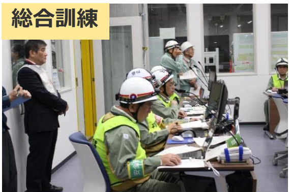
行動観察シートを用いて、総合訓練での活動をノンテクニカルスキルの視点で観察を行います。