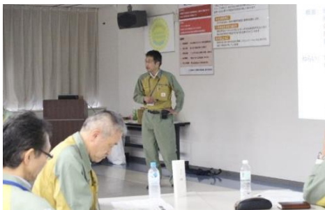
抽出した特性からノンテクニカルスキルを強化する訓練（協力：JANSI）を実施します。