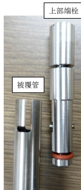
図1 燃料試料挿入管（試作品）の上部外観

なお、原子炉設置（変更）許可申請書（添付書類八 別1 第6.1-1表(2)）において、燃料試料挿入管の上部端栓の位置（被覆管の固定用切り欠き高さ）は下端より145cm以上としており、STACYが運転する臨界水位の上限である140cmより高い位置にあるため、通常の使用状態では燃料試料挿入管の内部に浸水するおそれはない（ 図2 参照）。