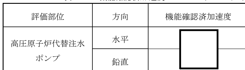
表 4-1 機能確認済加速度 ( \times 9.8\text{m/s}^2 )

なお、高圧原子炉代替注水ポンプは、VI-2-1-9「機能維持の基本方針」に記載されていない原動機であるタービンと一体構造の横形ポンプであり、既往の研究によって機能維持が確認された適用機種と構造・作動原理が異なることから、個別の加振試験によって得られる機能維持を確認した加速度を動的機能確認済加速度とする。機能確認済加速度を表 4-1 に示す。