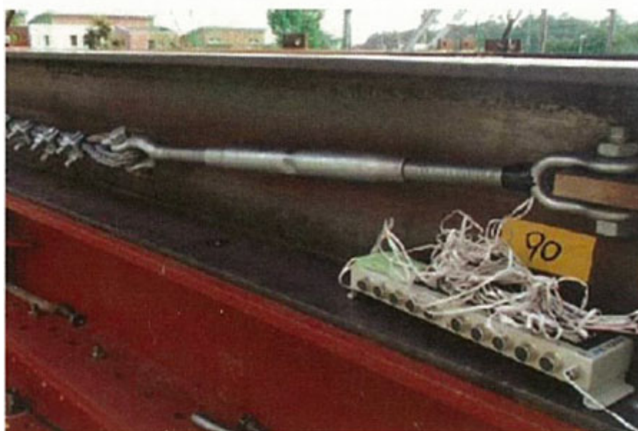
第3-1図 ひずみゲージ付きターンバックルの設置状況

ワイヤロープの初期張力については、電力中央研究所（以下「電中研」という。）報告書「高強度金網を用いた竜巻飛来物対策工の合理的な衝撃応答評価手法（総合報告：O01）」の試験時に測定しており、第3-1図に示すワイヤロープ端部のターンバックルにひずみゲージを取り付けて、軸力を出力することでワイヤロープの初期張力を測定した。なお、ターンバックルの締め付けトルク値は20N・mである。