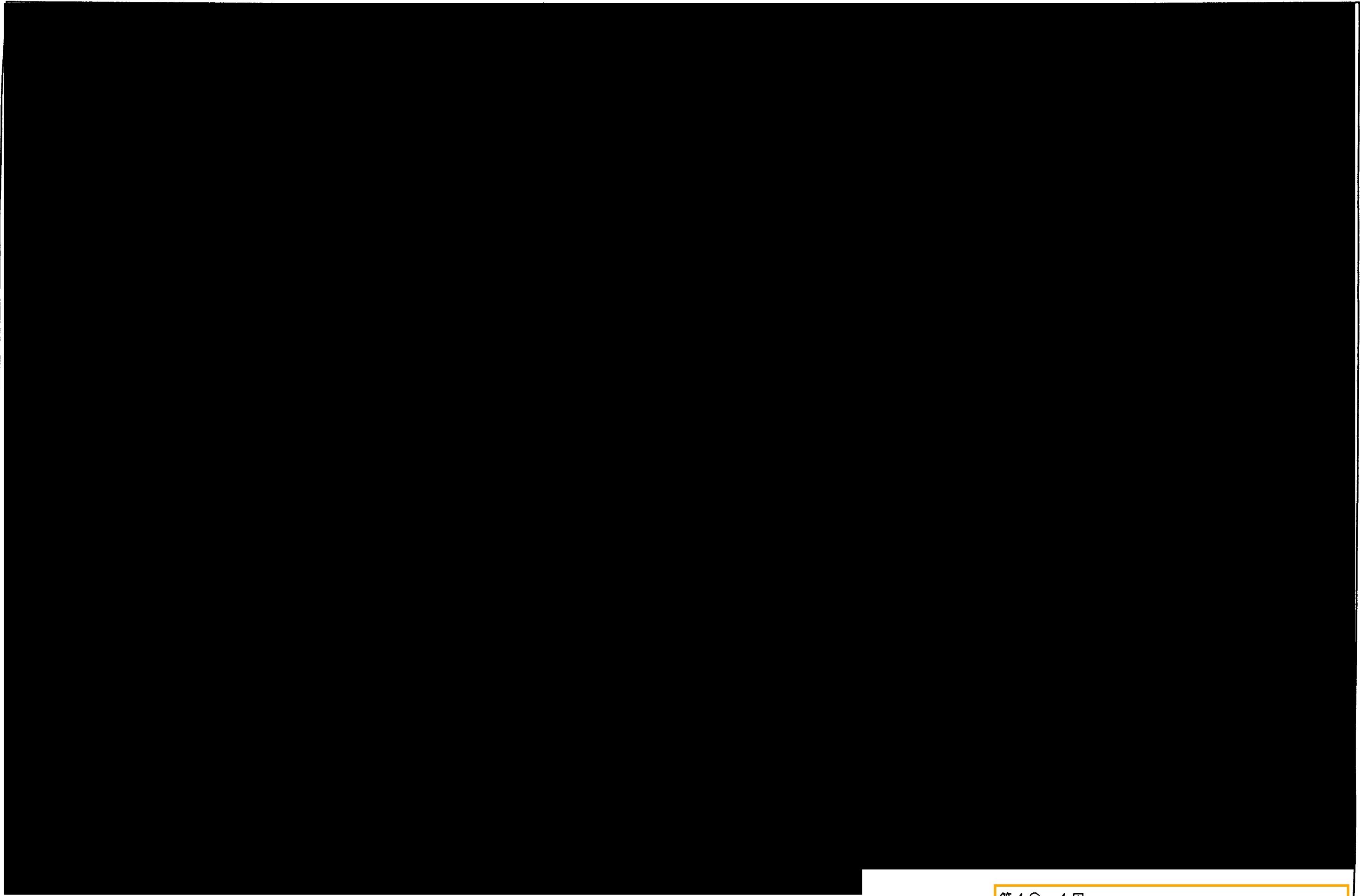
第18.1図 安全冷却水系の安全上重要な施設の範囲図(その1)