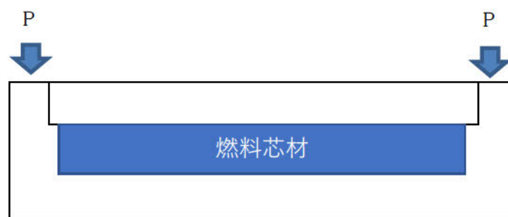
图 2 燃料要素构造 (断面图)