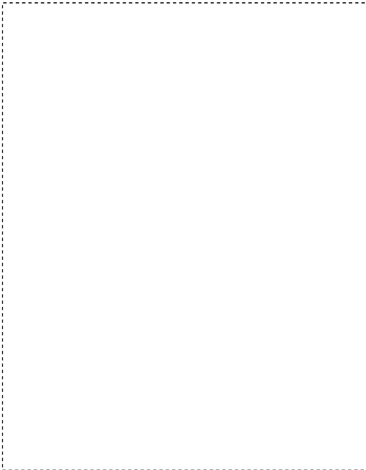
図 1. {2054}焙焼炉 No.2-1 粉末取扱機の構造