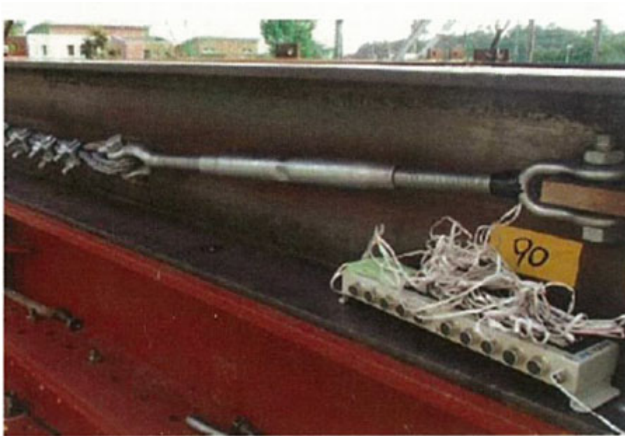
第3-1図 ひずみゲージ付きターンバックルの設置状況

ワイヤロープの初期張力については、電力中央研究所（以下「電中研」という。）報告書「 高強度金網を用いた竜巻飛来物対策工の合理的な衝撃応答評価手法（総合報告：O01） 」の試験時に測定しており、第3-1図に示すワイヤロープ端部のターンバックルにひずみゲージを取り付けて、軸力を出力することでワイヤロープの初期張力を測定した。なお、ターンバックルの締め付けトルク値は20N・mである。