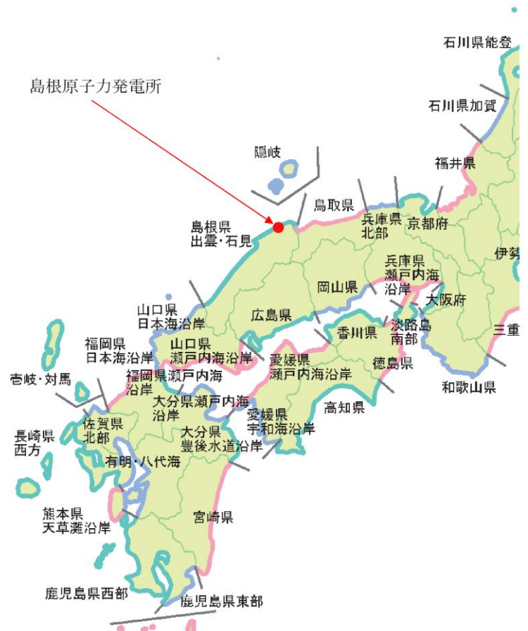
第1.0.8-1図 気象庁が定める津波予報区