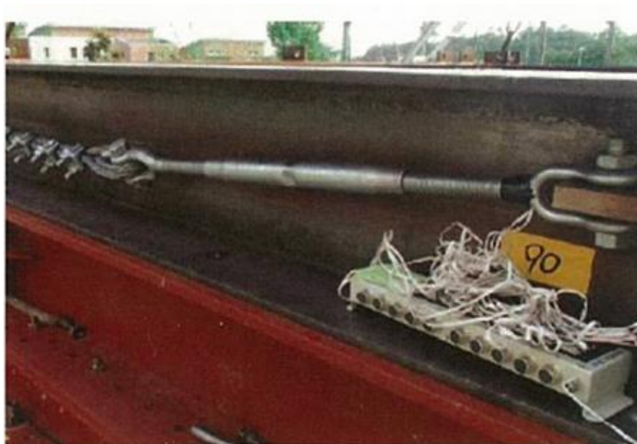
第3-1図 ひずみゲージ付きターンバックルの設置状況

ワイヤロープの初期張力については、電力中央研究所（以下「電中研」という。）試験時に測定しており、第3-1図に示すワイヤロープ端部のターンバックルにひずみゲージを取り付けて、軸力を出力することでワイヤロープの初期張力を測定した。なお、ターンバックルの締め付けトルク値は 20\text{N}\cdot\text{m} である。