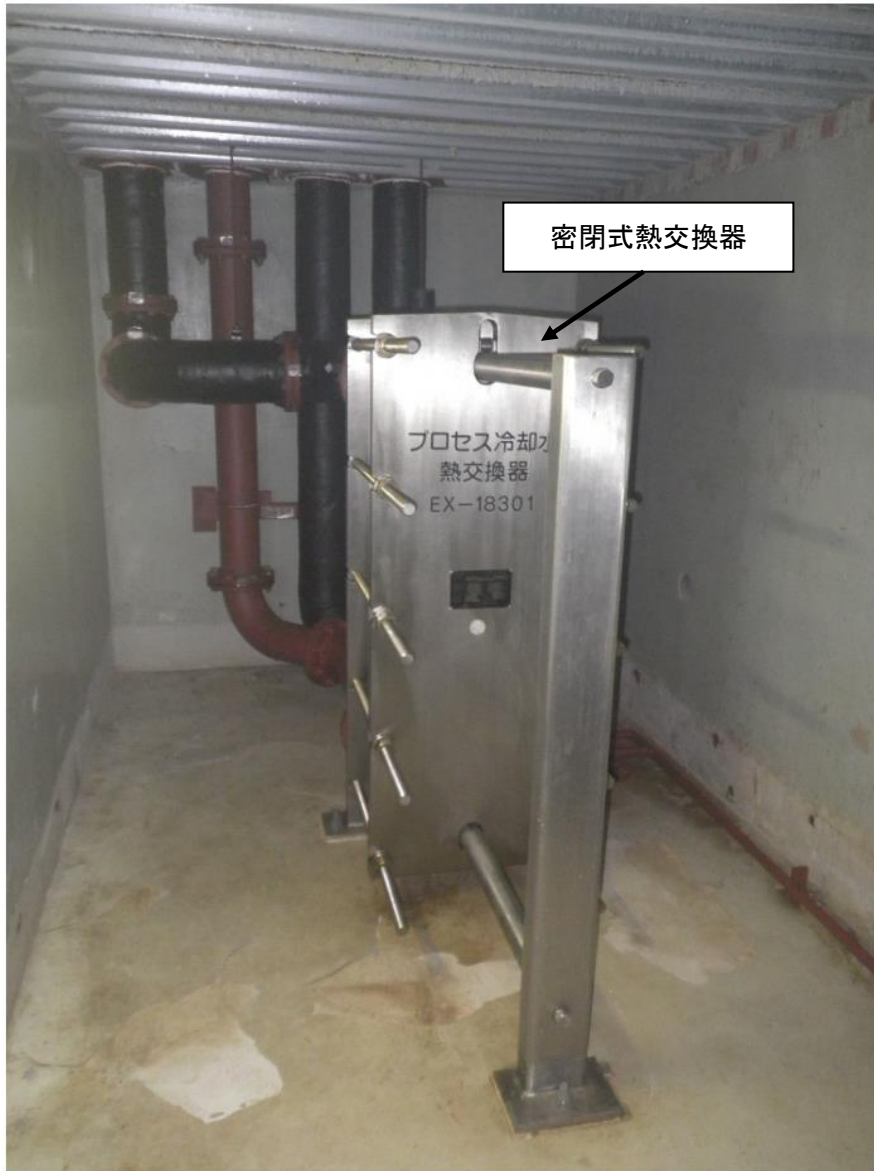
図3 現在の熱交換槽内部（角型ピット）