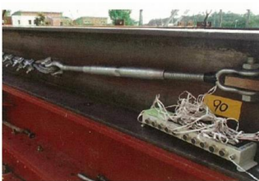
第3-1図 ひずみゲージ付きターンバックルの設置状況

ワイヤロープの初期張力については、電力中央研究所の試験時に測定しており、 第3-1図 に示すワイヤロープ端部のターンバックルにひずみゲージを取り付けて、 軸力を計測 することでワイヤロープの初期張力を測定した。なお、ターンバックルの締め付けトルク値は 20\text{N}\cdot\text{m} である。