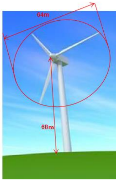
第1図 風力発電設備の寸法