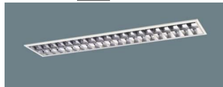
非常用照明（避難用）例